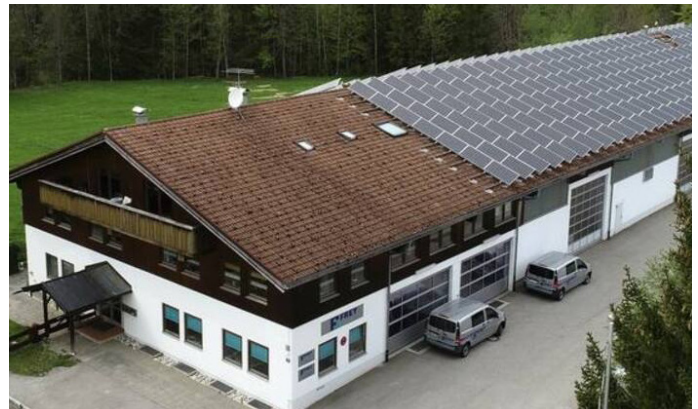
Werk von Frey und Co., Lenggries Fleck, Südbayern

Die EasyISO-Serie ist mit einem Druckbehälter, einem Druckübersetzer und einem in den Pressenrahmen eingebauten Verriegelungszylinder ausgestattet. Die Maschinen haben einen modularen Aufbau für Presskräfte von 2.000 bis 10.000 KN und können an spezifische Kundenanforderungen angepasst werden. Kurz gesagt, jede Presse kann innerhalb bestimmter Rahmenbedingungen für