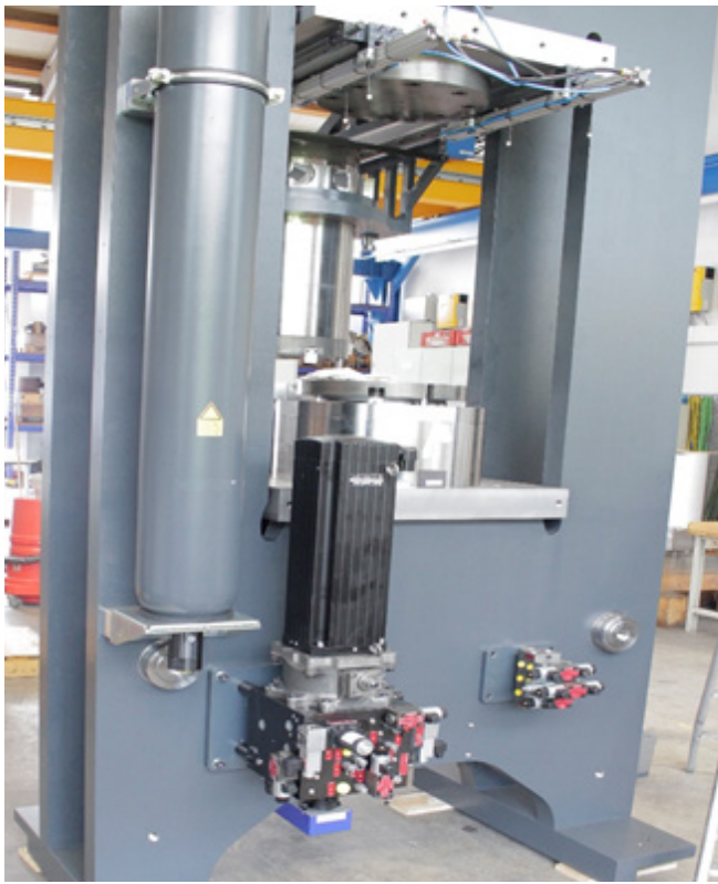
Frey EasyISO Keramik-Pressen mit Moog EAS