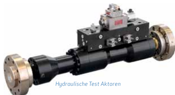
Hydraulische Test Aktoren