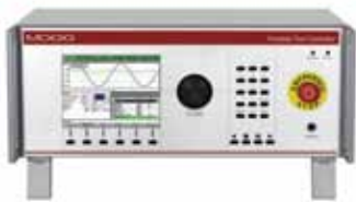
Portable Test Controller